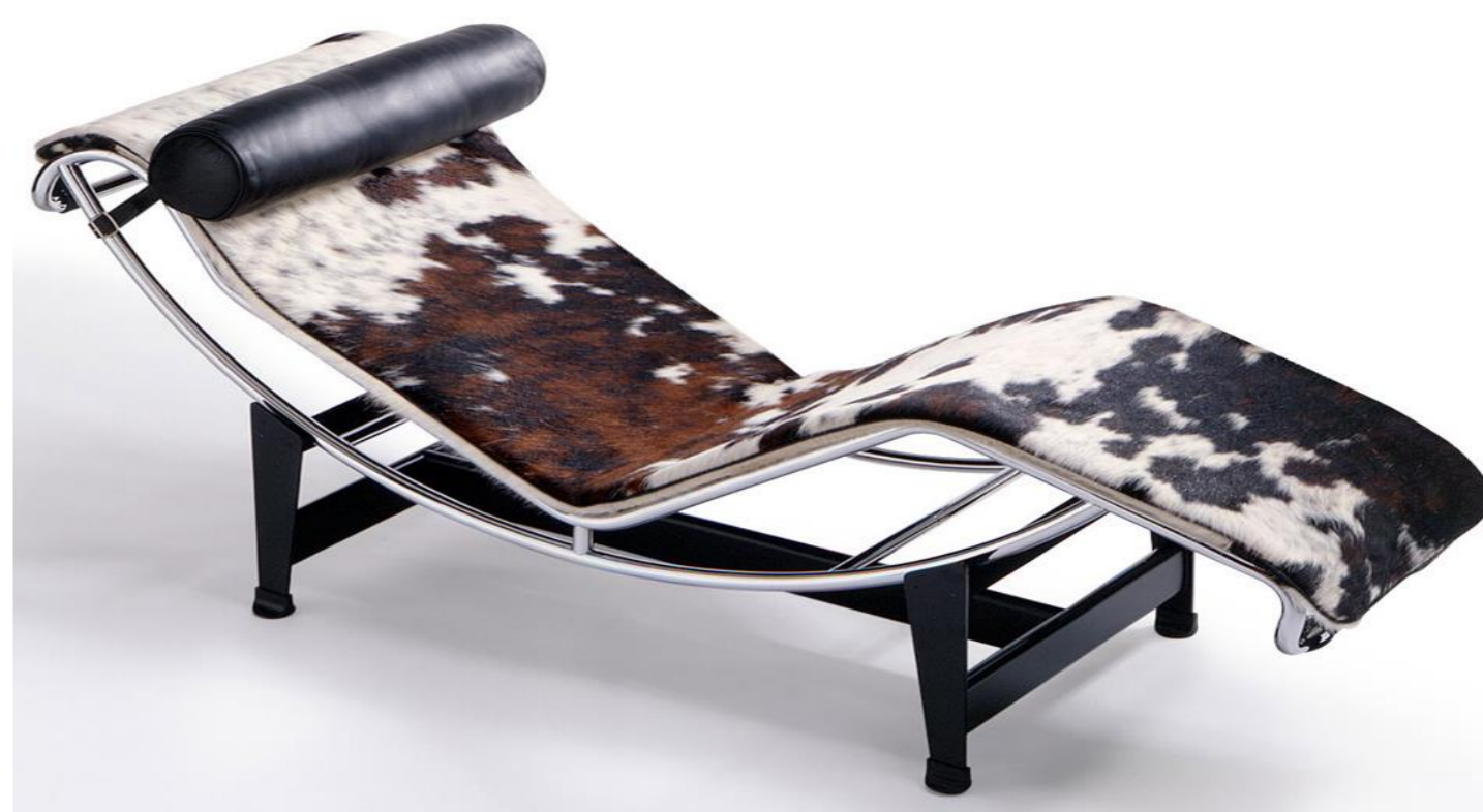
Figura 1 Chaise Longue

Um dos artigos desse mobiliário é a Chaise Lounge , com formas orgânicas e um clássico estofamento em couro macio, deixando leve e flexível, possui uma peça com mecanismo de posicionamento ajustável para promover o relaxamento total.