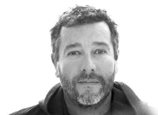
Figura 3 – Philippe Starck

Tem como suporte quatro pés estreitos e um acabamento especial que lhe proporciona uma aparência aveludada. O verdadeiro traço distintivo da cadeira é, naturalmente, seu espaldar, caracterizado pelos espaços cheios e vazios, criados pelo cruzamento sinuoso dos três diferentes elementos estruturais. Disponível em diversas cores, a Masters é leve, prática, empilhável e pode ser utilizada em ambientes externos. A cadeira Masters foi homenageada com o prestigioso “Good Design Award 2010”, concedido pelo Chicago Athenaeum – Museum of Architecture and Design .