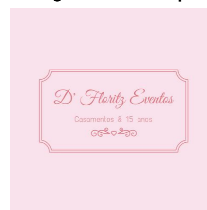
Figura 1 – Logomarca do empreendimento