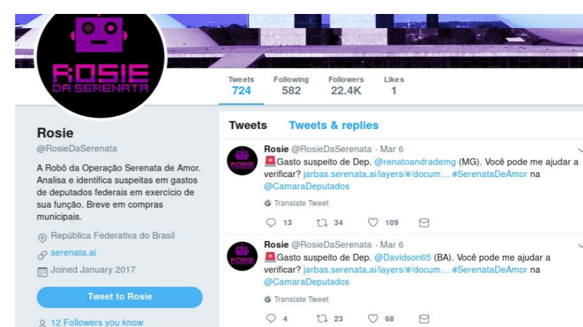
Figura 1: Rosie robô serenata de amor

Para expor os bots identificados optou-se por pelo método “Serenata de amor” (figura 1), por apresentar um método consolidado e simples para apresentar resultados.