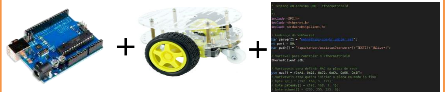
Figura 1 – Placa Uno Arduino e parte da codificação para interagir com WebSocket

O Arduino é um dispositivo barato, funcional e fácil de programar, sendo dessa forma acessível a estudantes e projetistas amadores. Além disso, foi adotado o conceito de hardware livre, o que significa que qualquer um pode montar, modificar, melhorar e personalizar o Arduino, partindo do mesmo hardware básico. O terceiro encontro objetiva a integração da teoria com a prática e para isso foi escolhido o desenvolvimento de uma aplicação web para controlar um robô.