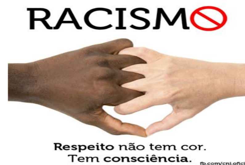
Figura 1. Racismo e consciência