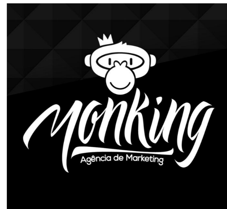
Figura 1 – Marca Monking Agência de Marketing

A Balanced Scorecard, usada pela empresa, é uma ferramenta de planejamento estratégico apresentada por Robert S. Kaplan e David P. Norton, ambos professores de Harvard, no ano de 1992. A BSC tem como principal objetivo integrar seus quatro indicadores, fornecendo uma visão de desempenho. Essas quatro perspectivas eram: a perspectiva dos clientes, conduzindo a maneira que a empresa demonstra valor ao cliente; a perspectiva dos processos internos, que é a preocupação com a melhora da performance do produto oferecido; a perspectiva financeira, responsável por criar novos indicadores de desempenho; e a do aprendizado e crescimento, que desenvolve objetivos e medidas para aumentar o crescimento organizacional. A união desses fatores alinha os objetivos à estratégia de organização, aperfeiçoando o planejamento e facilitando conquistas.