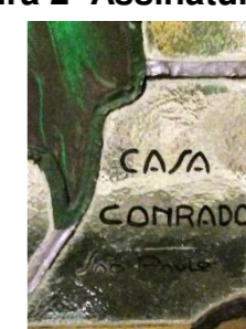
Figura 2- Assinatura do Ateliê