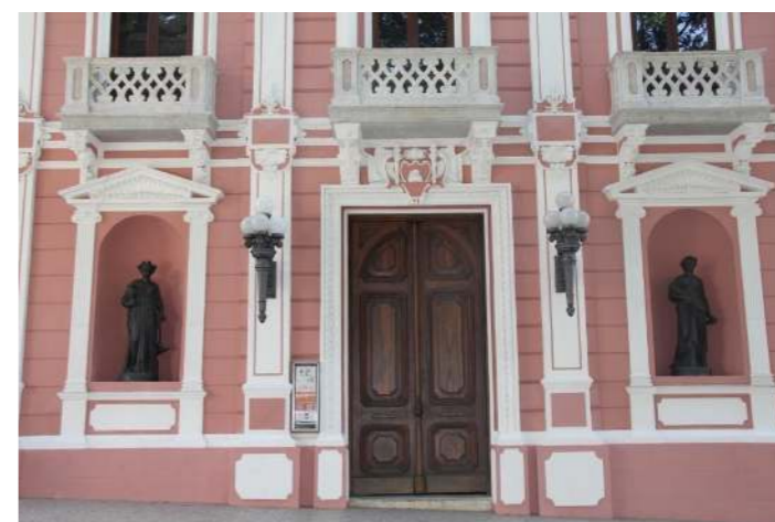
Figura 2. Porta principal.

PORTA: A porta original do Palácio Cruz e Sousa foi produzida no início do século XVIII e faz parte da arquitetura original do Museu. Confeccionada com a madeira proveniente da árvore nativa denominada canela (Ocotea SP.); um produto tipicamente brasileiro. A porta possui, ainda, os ferrolhos originais – antigamente utilizados para amparar a carruagem do rei e da rainha – e também a caixa de correio, onde eram depositadas as correspondências da época. Ao redor da porta é possível identificar estruturas arquitetônicas que fazem referência a relevância da construção, primeiramente construída para abrigar a casa oficial do Governo da Capitania da Ilha de Santa Catarina, durante o Brasil Colônia, posteriormente utilizada como sede do Governo do Estado (informação verbal).