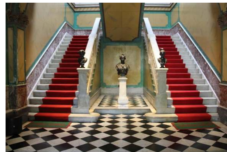
Figura 1. Saguão principal.

ESCADA E PISO: A escada e o piso do saguão principal do Museu Histórico de Santa Catarina (MHSC) são um dos pontos altos da decoração imponente do Palácio, produzidos inteiramente de Mármore Carrara, os itens foram trazidos da Itália, da região de Carrara – localizada ao norte da atual Toscana – com o objetivo de transformar o estilo do antigo casarão da colônia em um palácio imponente, fazendo jus a nova república. Tanto a escada, quanto o piso e os pedestais da entrada principal do museu fazem referência ao estilo barroco e chegaram ao Brasil em módulos e foram montados em 1894. A disposição dos itens foi pensada e executada de acordo com as tradições da época, onde o rei descia primeiro as escadas – pelo lado direito – posteriormente acompanhando da rainha, que seguia pelo lado esquerdo (informação verbal).