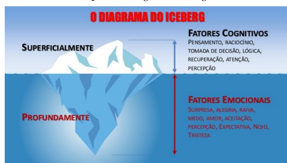
Quadro 1 – Diagrama do iceberg