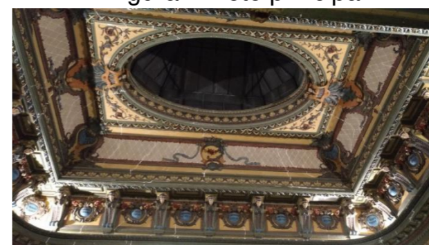
Figura 1. Teto principal

TETO PRINCIPAL: Teto confeccionado utilizando a técnica de Estuque, com elementos clássicos como “coquillage”, festão, consolos, douração e uma clara-bóia central (BURDEN, 2006).