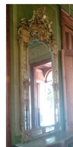
Figura 3. Espelhos

ESPELHOS: franceses em madeira trabalhada em dourado com características vitorianas com cristal puro, capaz de refletir fielmente sem distorção. Posicionados estrategicamente para refletir a imagem quatro vezes (informação verbal).