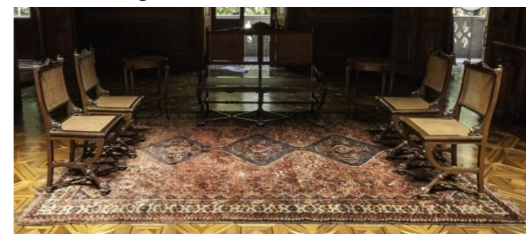
Figura 2 . Banco e Cadeiras

BANCO E CADEIRAS: do século XIX confeccionado com a madeira nativa, possivelmente com jacarandá em estilo torneado, pernas dianteiras arqueadas e pés que imitam patas. Assento e encosto em palhinha indiana (MOUTINHO, 2011).