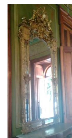
Figura 3. Espelhos

ESPELHOS: franceses em madeira trabalhada em dourado com características vitorianas com cristal puro, capaz de refletir fielmente sem distorção. Posicionados estrategicamente para refletir a imagem quatro vezes (informação verbal).