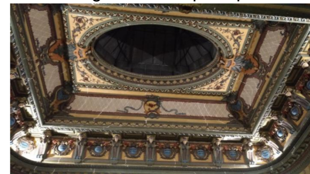
Figura 1. Teto principal

TETO PRINCIPAL: Teto confeccionado utilizando a técnica de Estuque, com elementos clássicos como “coquillage”, festão, consolos, douração e uma clara-bóia central (BURDEN, 2006).