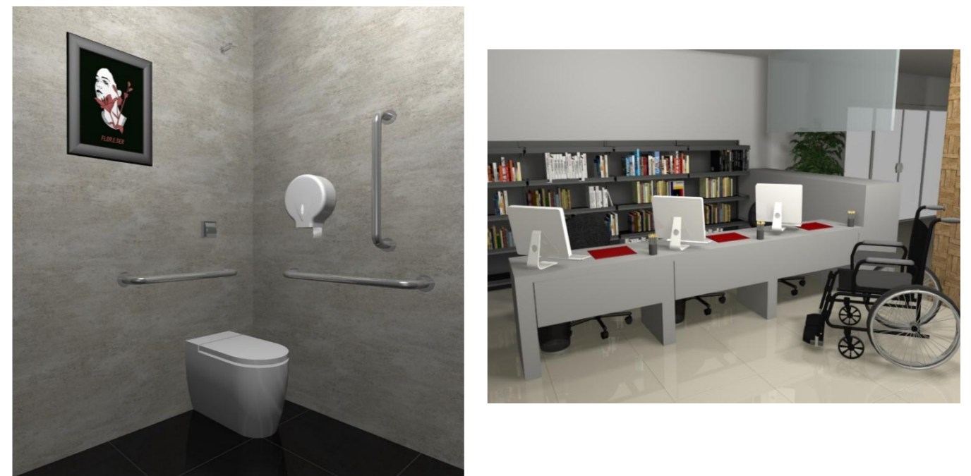
Figura 2. Proposta de banheiro e balcão de atendimento para Faculdade Cesusc