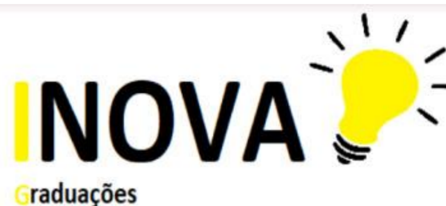
Figura 1. Proposta de logo para start up

O aplicativo conta também com diversos exemplos situacionais das matérias estudadas que acabam com a velha frase "nunca vou utilizar isso na minha vida".