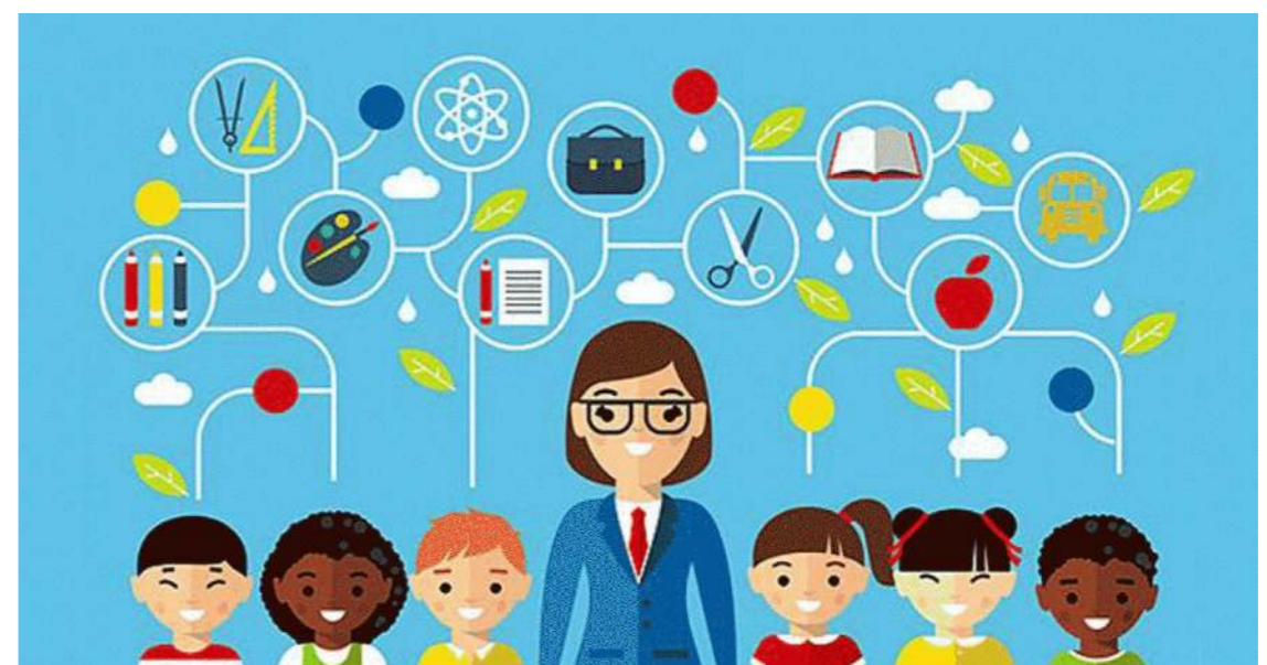
Figura 1. Proposta de logo para star up Intraschool

Com essa ideia pretende-se fazer com que os alunos entendam mais sobre o mercado de trabalho para que assim, cursem universidades que se identifiquem.