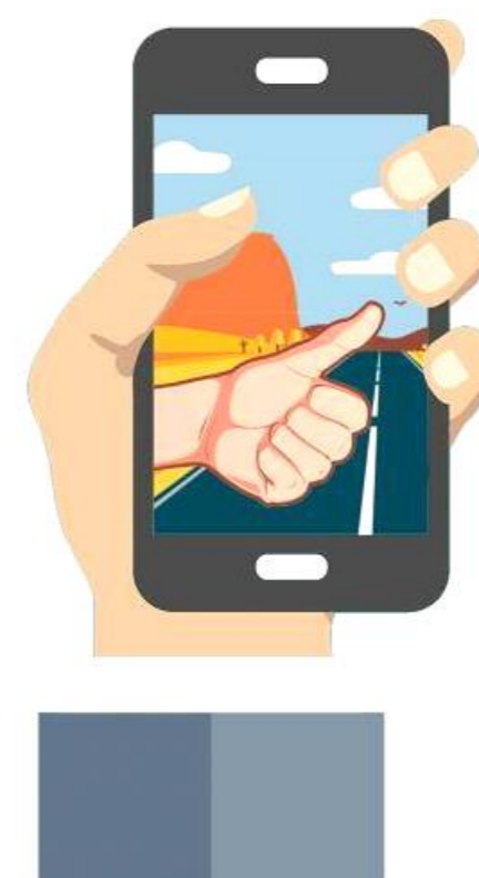
Figura 1. Proposta de logo para star up Tele carona

A startup está em estado de protótipo. Tem por propósito atender as universidades dando a eles mais segurança e mobilidade urbana, tendo em vista amenizar o trânsito em Florianópolis.