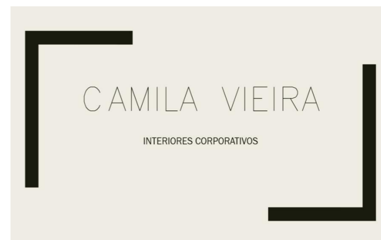
Figura 1 – Logomarca do Empreendimento

Por fim, foi elaborada a Matriz F.O.F.A (Quadro 1), onde avaliou-se os ambientes internos e externos e suas Forças, Fraquezas, Oportunidades e Ameaças.