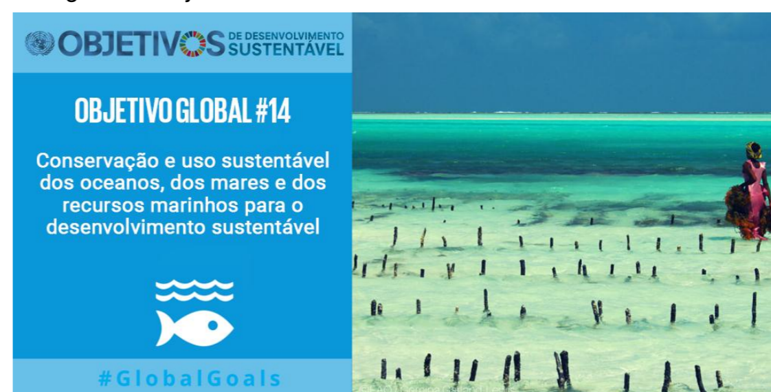
Figura 1. Objetivo de Desenvolvimento Sustentável 14

Projeto Route- ser uma rota de referência nacional que minimizem o impacto do consuma humano na praias, rios, mares, e lagoas atuando em 10 estados brasileiros.