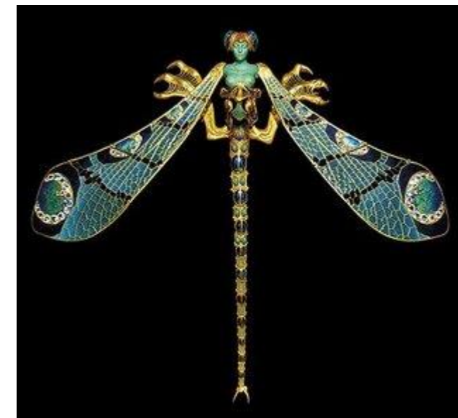
Mulher Libélula René Lalique

A arte das ilustrações em cartões, livros, especialmente os infantis também ganharam força e destaque. A principal conquista do Art Nouveau foi promover uma verdadeira unidade das artes. De modo geral, os móveis, os objetos, e o próprio edifício passaram a ser criados a partir de uma mesma tendência decorativa