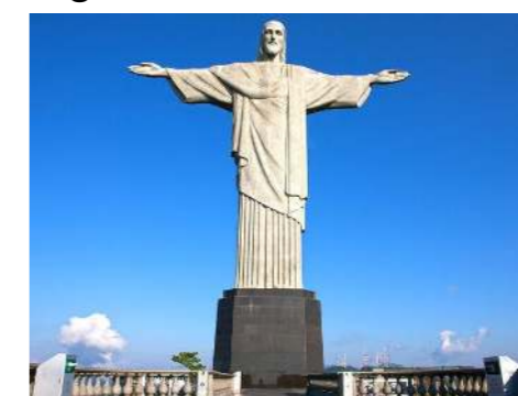
Figura 1. Cristo Redentor