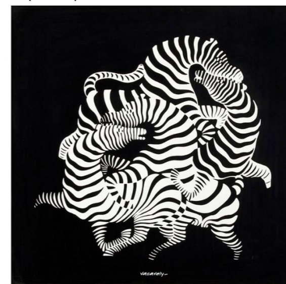
Figura 3. Victor Vasarely. Zebra , 1938

Victor Vasarely artista húngaro considerado o “Pai da Op Art”. Foi influenciado pela arte cinética, construtivista e abstrata bem como ao movimento de Bauhaus, donde destaca-se sua obra “Zebra” (1938).