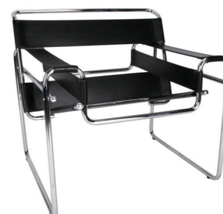
Figura 1, Mobiliário e tapete Bauhaus

Linhas curvas, cores primarias e formas geométricas simples, materiais com o tubo de aço.