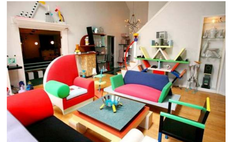
Figura 2 - Ettore Sottsass, mobiliário grupo Memphis