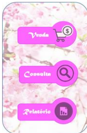
Figura 3 - Escolhendo a opção de venda, aparecerá os produtos possíveis para venda.