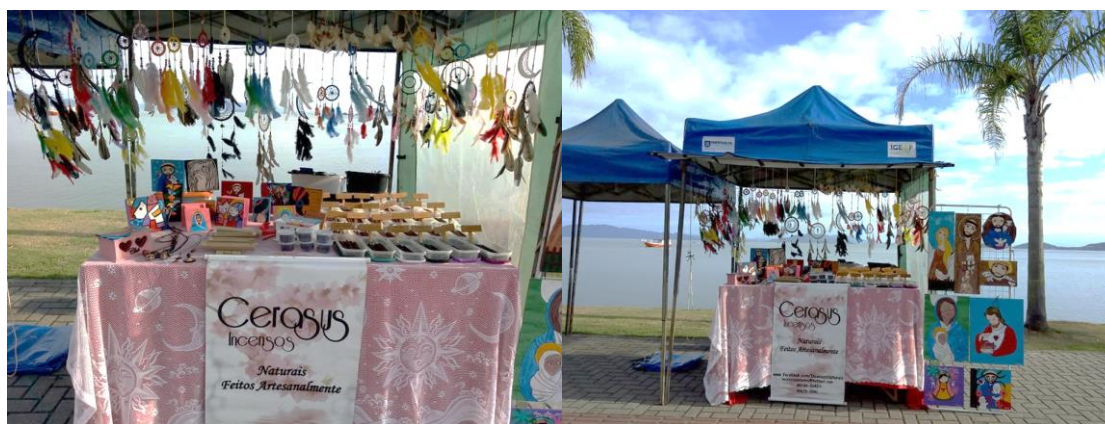
Imagem 2 - Fazendo a venda dos incensos

Imagem 1 - Feira montada na Beira Mar Norte – Florianópolis