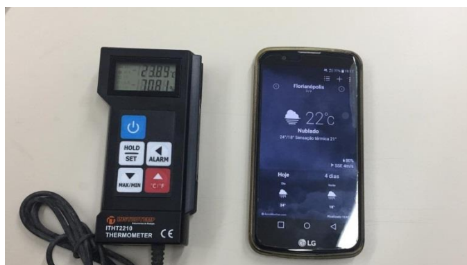
Figura 4. Teste comparativo Apps e Termômetro

Nenhum dos aplicativos foi qualificado porque ambos apenas consultavam dados on line sobre temperaturas do local de pesquisa ao invés de captar informações do ambiente em questão. Os dispositivos móveis, em geral, não dispõem de equipamentos que permitam a medição de temperatura. Por outro lado, existem dimensionadores capazes de auxiliar o profissional de Design de Interiores a calcular a necessidade de condicionamento de ar para garantir o conforto térmico em um projeto. Foi testado o dimensionador da marca Springer disponível gratuitamente que permite cálculos para ambientes que serão utilizados por até dez pessoas.