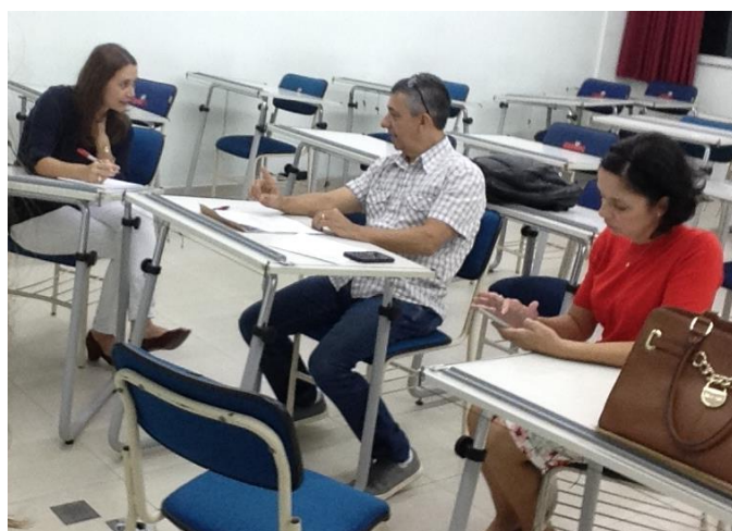
Figura 6. Discussão sobre efetividade de aplicativos para Desenho Arquitetônico