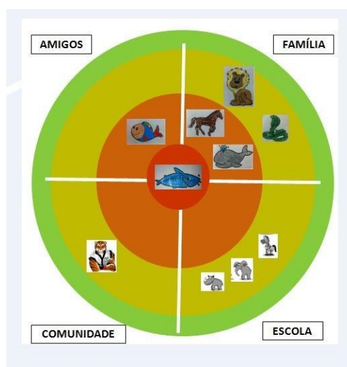
Figura 4 - Mapa de rede